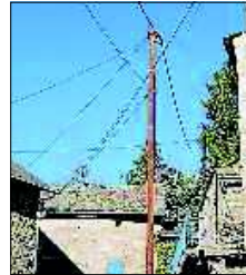
■ L'enfouissement des réseaux va se poursuivre.

Il est à ce jour en cours d'officialisation et les travaux seront bientôt lancés. Un programme important mais avec des aides, fort heureusement. Par la même occasion, la commune va procéder à un enfouissement des réseaux, au moins dans certaines zones. Il est vrai qu'aux Combettes, les