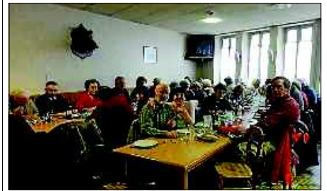
■ Le repas du chevreuil a été animé pour les aînés ruraux.

Une fois n'est pas coutume. Et, c'est avec le repas du chevreuil que les amis du club des Anciens jeunes ont fêté le Saint-Valentin, en dégustant le chevreuil offert par la Diane du lieu. L'après-midi fut fort bien occupée, airs d'harmonica sur lesquels l'on put esquiser quelques pas de danse, parties de belote endiablées, scrabble, sans oublier les discussions où l'on refait le monde. L'heure du départ arriva