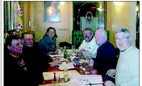
■ Les Jardiniers de France ont préparé leurs prochains ateliers.