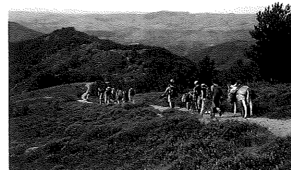
Sur le Bougès.

Nous voulons aussi célébrer le voyage à pied, l'aventure de l'itinérance dont Stevenson fut le pionnier, sur les deux jours du samedi 8 et dimanche 9 novembre en décrétant « Florac, Capitale de la Randonnée ». Ces deux jours auront pour thème majeur « les Grands Itinéraires de Randonnée » et seront animés en partenariat avec la Fédération Française de la Randonnée, la Grande Traversée des Alpes et la Grande Traversée du Jura. L'objectif est la mutualisation de la promotion de ces chemins à thème et la mise en lumière de la marche à pied en général. C'est aussi l'occasion donnée aux territoires d'itinérance de se montrer et de se faire connaître.