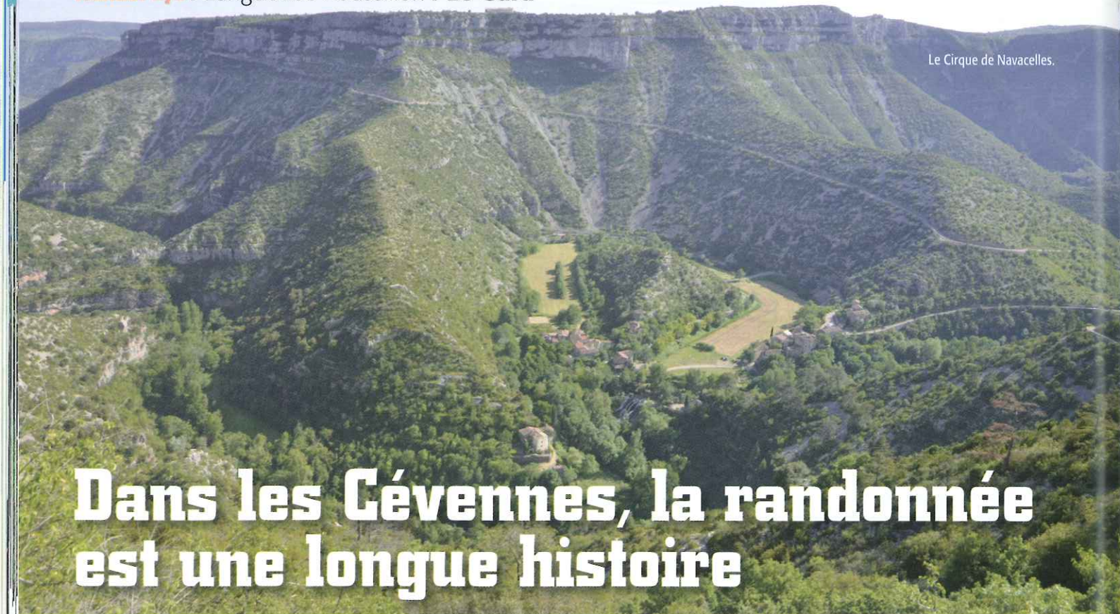
Le Cirque de Navacelles.