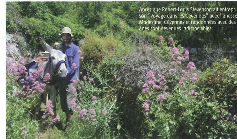
Après que Robert-Louis Stevenson ait entrepris son "Voyage dans les Cévennes" avec l'ânesse Modestine, Cévennes et randonnées avec des ânes sont devenues indissociables.