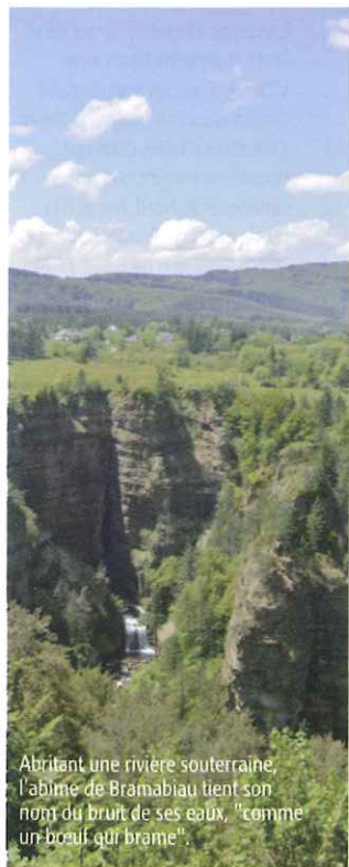
Abritant une rivière souterraine, l'abîme de Bramabiau tient son nom du bruit de ses eaux, "comme un bœuf qui brame".

A LA CROISÉE DU LANGUEDOC ET DE LA PROVENCE, LE DÉPARTEMENT DU GARD EST SILLONNÉ DE VOIES ANCESTRALES. CHEMINS DE SAINT-GUILHEM, DE STEVENSON ET DE RÉGORDANE, VOIE ROMAINE DOMITIENNE, OU ENCORE VOIE COMPOSTELLANE DITE ROUTE D'ARLES, AUTANT D'ITINÉRAIRES SÉCULAIRES ET D'INVITATIONS À REMONTER LE TEMPS. MORCEAUX CHOISIS : CHEMIN DE SAINT-GUILHEM ET CHEMIN DE STEVENSON.