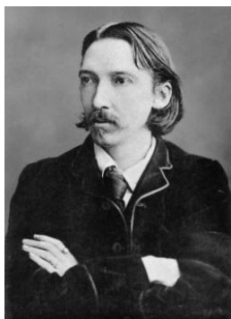
Robert Louis Stevenson , 1850, Ecosse – 1894, Samoa.